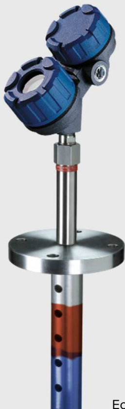
Eclipse 705 se sondou 7MN